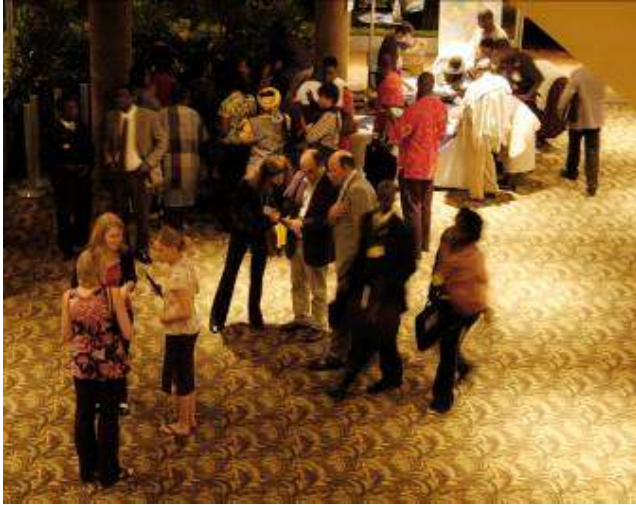
Delegates registered in the foyer before the opening gala dinner.