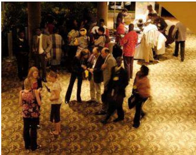
Delegados registam no hotel antes do jantar de gala.