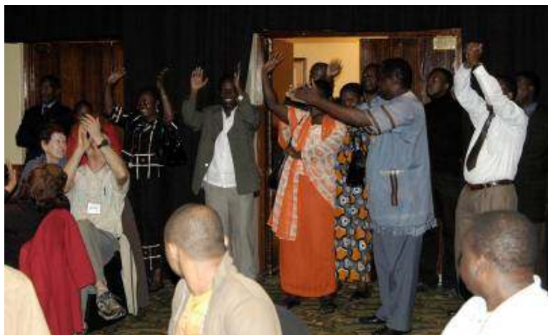
O equipa de Kadira, Tanzania chegou com bater palmas.

Os delegados entrevistados eram excitados por estar aqui, ansiosos para aprender com os outros e fazer no vos amigos.